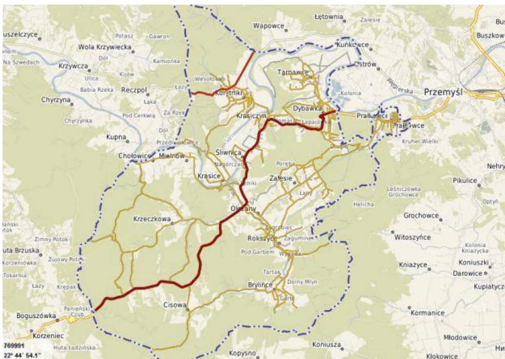
Mapa 3. Podział gminy na sołectwa