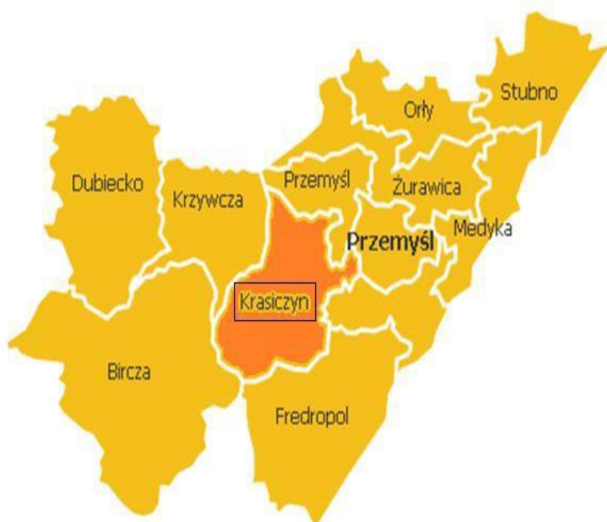
Mapa 1. Położenie Gminy Krasiczyn na tle powiatu przemyskiego

W latach 1975-1998 miejscowość położona była w województwie przemyskim.