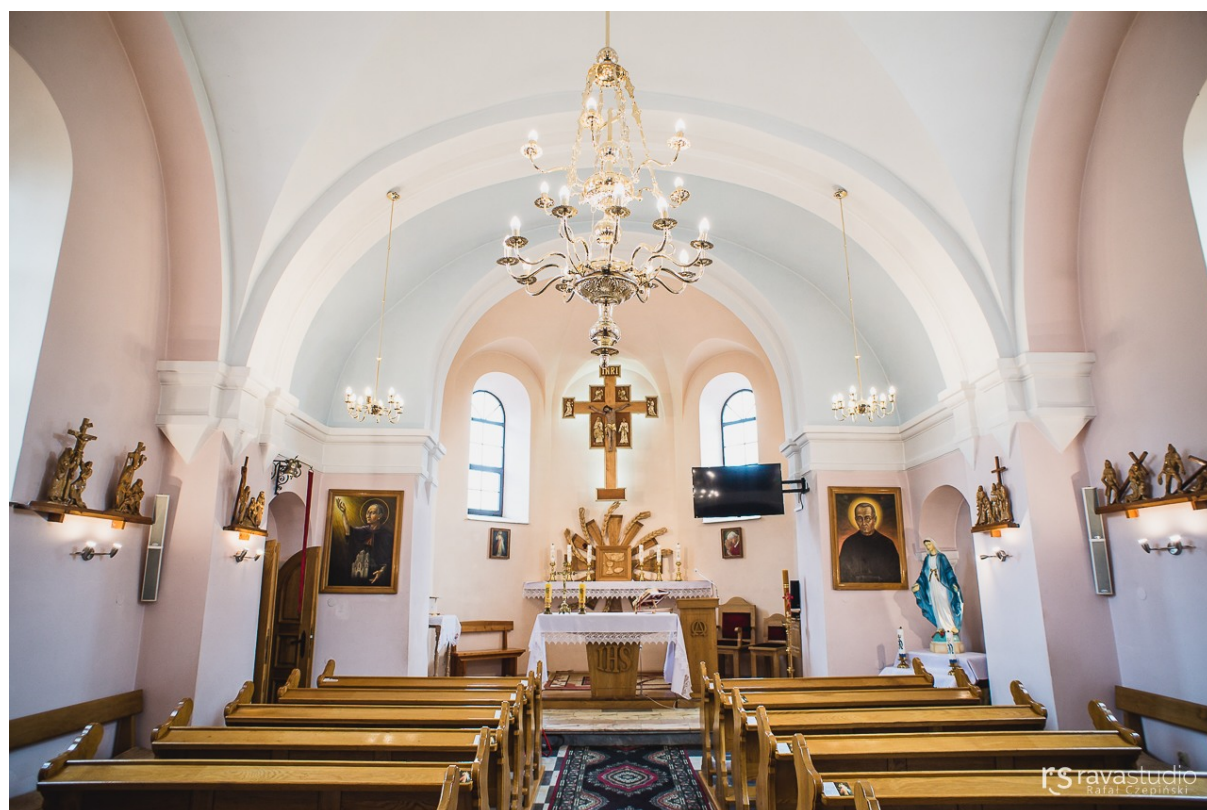
Kościół w Korytnikach