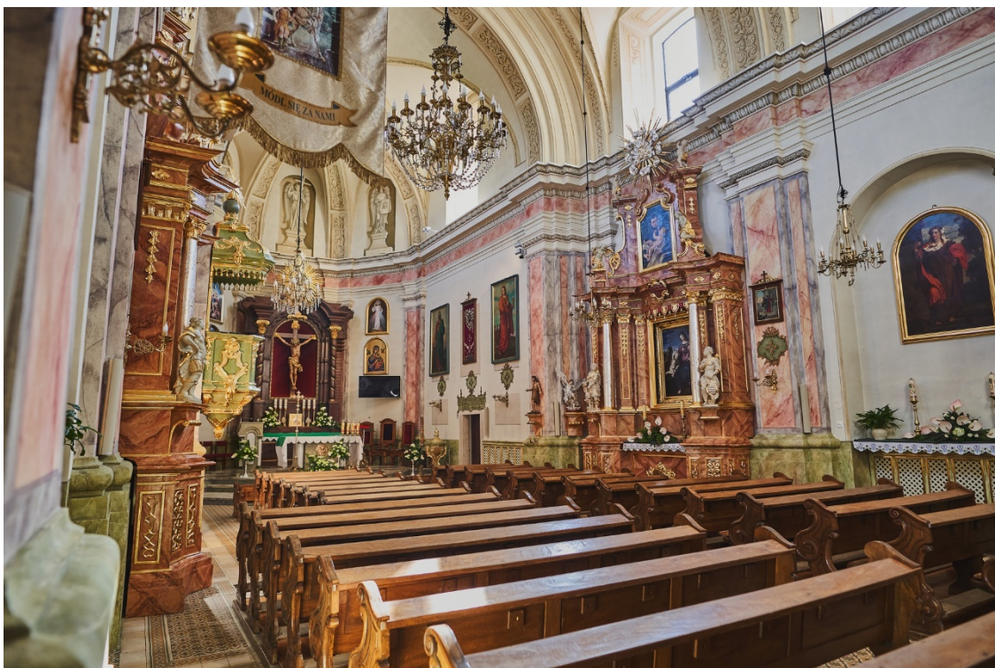
Kościół w Krasieczynie