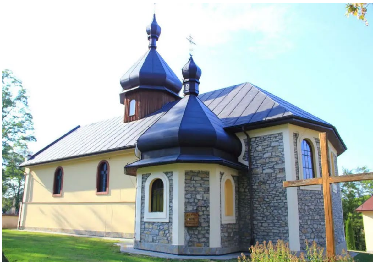
Kościół w Olszanach