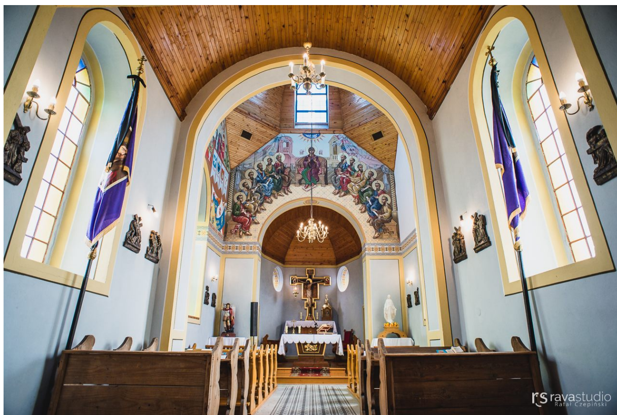
Kościół w Chołowicach