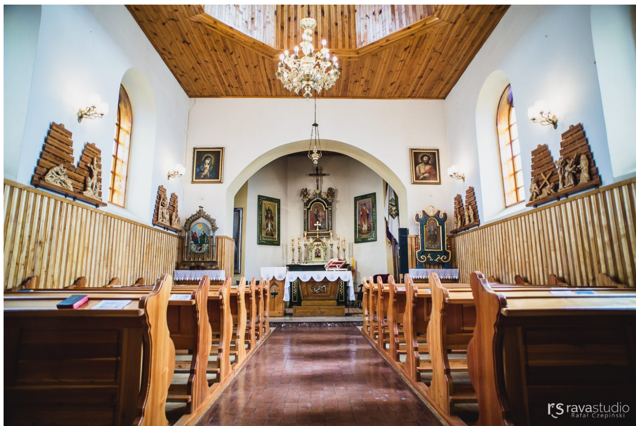
Kościół w Mielnowie