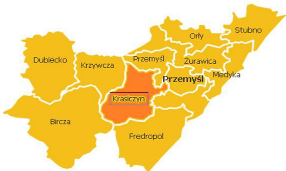
Mapa 1. Położenie Gminy Krasiczyn na tle powiatu przemyskiego

W granicach administracyjnych Gminy Krasiczyn, wg danych z Powszechnego Spisu Rolnego w 2020 roku, znajdowało się 630 gospodarstw rolnych zajmujących powierzchnię 2 691 ha. Ponad 88,88% ogólnej liczby gospodarstw posiada powierzchnię do 5 ha, natomiast tylko 30 gospodarstw (4,8% ogółu) to gospodarstwa o powierzchni przekraczającej 10 ha. Średnia wielkość gospodarstwa wynosi około 4,20 ha.