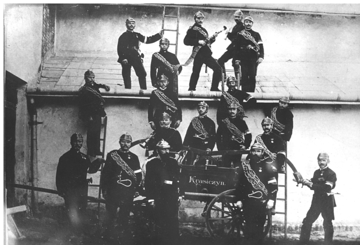
OSP Krasiczyn w 1909 roku.