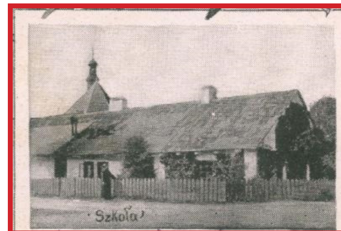
Stara szkoła w Krasiczynie