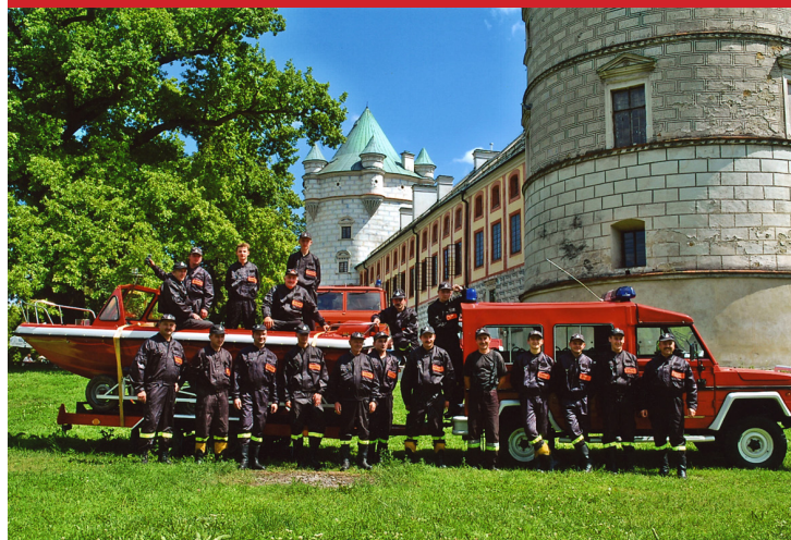
OSP Krasiczyn w 2004 roku.