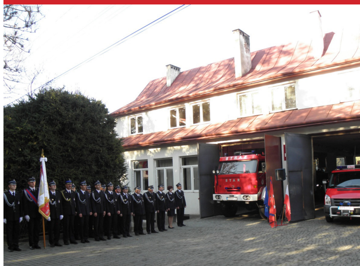
OSP Krasiczyn w 2012 roku.