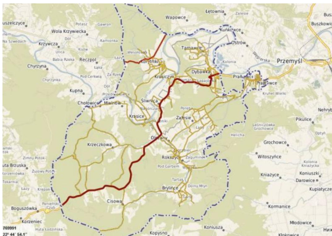
Mapa 2. Miejscowości na terenie Gminy Krasieczyn