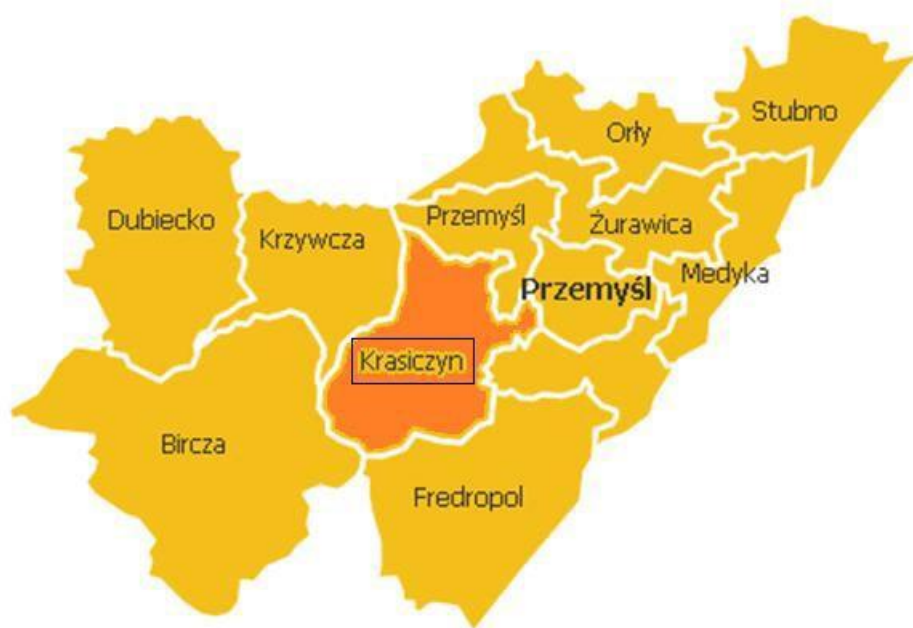
Mapa 1. Położenie Gminy Krasieczyn na tle powiatu przemyskiego

Gmina Krasieczyn leżąca w centralnej części powiatu przemyskiego od północy graniczy z gminą Przemyśl, od południa z gminą Fredropol, od wschodu z miastem oraz gminą Przemyśl, a od zachodu z gminą Krzywczyna i Birczą.